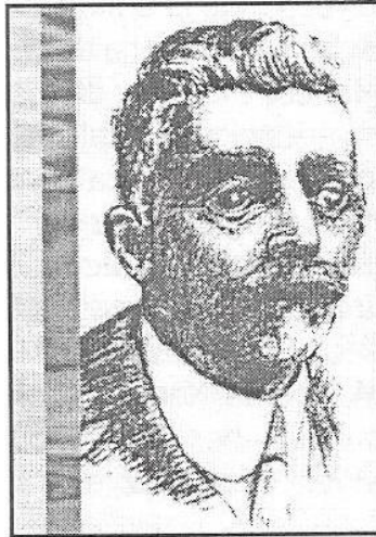
Capitão GN Joao Simoes Lopes Neto