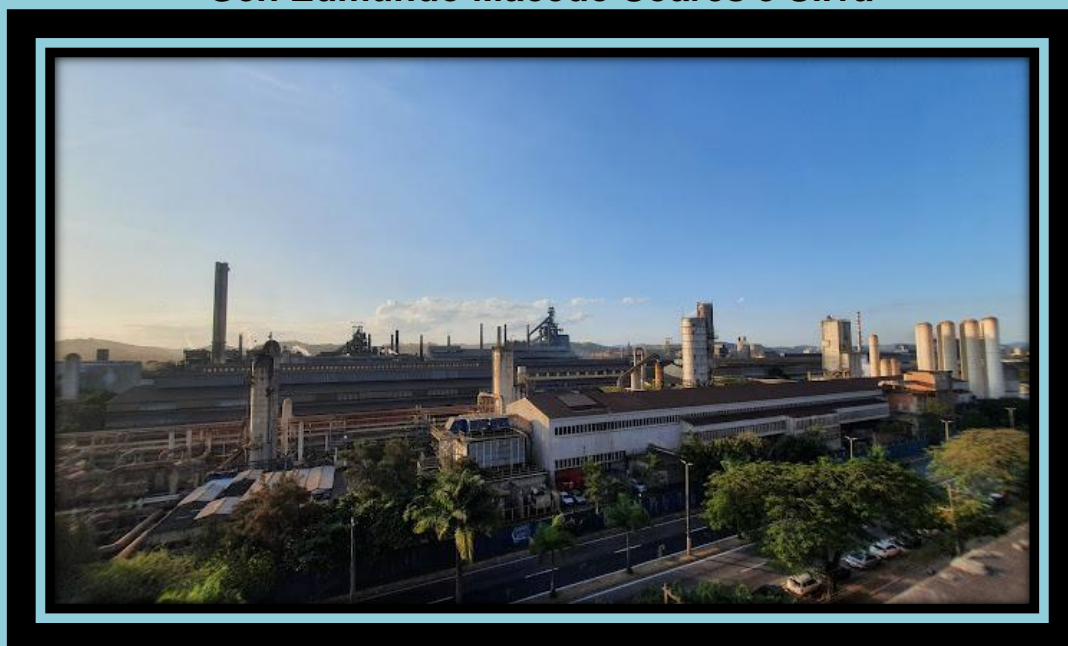
Visão da usina siderúrgica nacional em Volta Redonda.