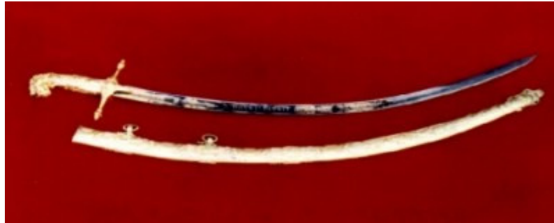
Foto de um Espadim de Caxias dos Cadetes do Exército

anualmente. desde a primeira entrega em 1932 do Espadim de Caxias, aos Cadetes do Exército, que consiste numa cópia fiel em escala, da invicta espada de 6 campanhas do Duque de Caxias, o patrono do Exército e da Federação de Academias de História Militar Terrestre do Brasil(FAHIMTB) História que rememorarei a seguir.